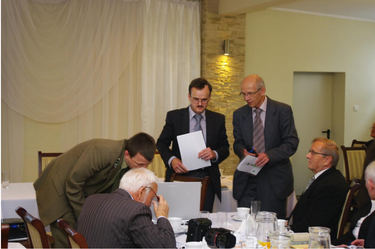
Ryc. 11. Mamy problem?