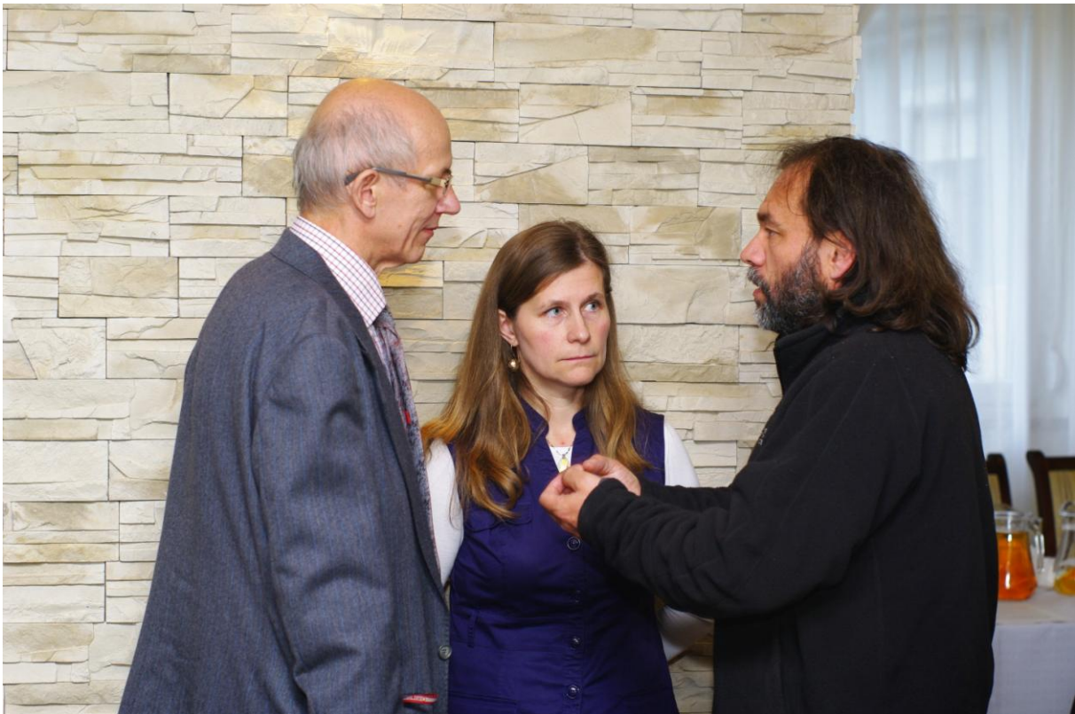
Ryc. 12. Dyskusja